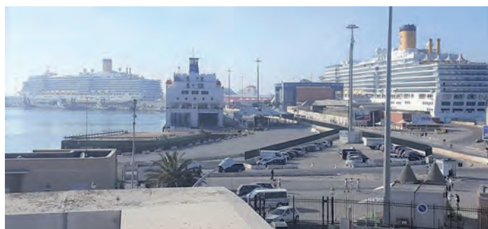
Il porto di Bari