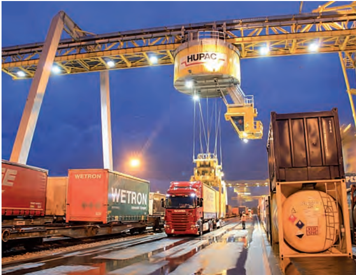
Lavoro notturno al terminal Hupac