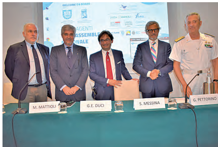
Tavola dei relatori a Federagenti

ma portuale fuori dall'elenco Istat (165/2001) quantomeno per gli aspetti laburistici 7) Revisione legge Dragaggi 8) Agenzia delle Dogane funzionalmente sottoposta al MIT (come la Guardia Costiera) 9) Ritorno di Sindaci e Presidenti Regione in organi di ge-