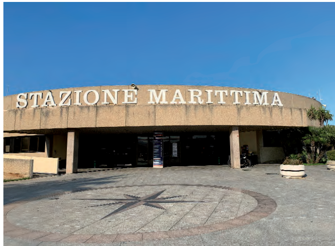
La Stazione Marittima di Olbia

Per quanto riguarda la parte tecnica, la ripartizione dei punteggi interesserà gli aspetti architettonici degli interventi e delle soluzioni adottate; la distribuzione e le modalità di sfruttamento degli spazi interni