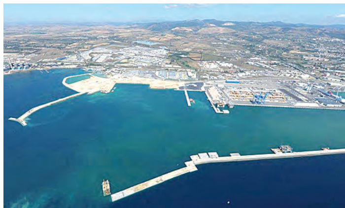
Panoramica del porto di Civitavecchia

"Il porto di Civitavecchia quest'anno varcherà la soglia dei 2,5 milioni di passeggeri crocieristi e considerando che, secondo le previsioni, il settore crocieristico continuerà ad aumentare anche nei prossimi anni, è necessario cogliere questa opportunità per creare nuove sinergie tra il porto e l'area retroportuale, così come dovrebbe accadere per tutti i