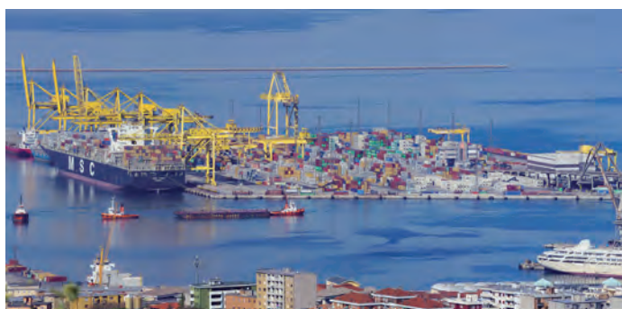
Una veduta del porto di Trieste