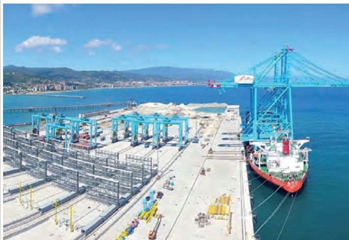
L'arrivo delle gru nel porto di Savona Vado

VADO LIGURE – Sono arrivate nel porto di Vado Ligure altre tre gru "di banchina" (STS – Ship to shore) che andranno a operare nel terminal Vado Gateway la cui apertura è prevista il 12 Dicembre prossimo. La prima gru era arrivata a Dicembre 2018 e ora la dotazione di STS necessaria per l'apertura del nuovo terminal è stata completata.