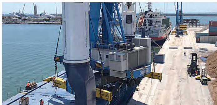
Un momento dello sbarco delle gru

Già durante lo scorso anno, i soci del Tco avevano deliberato