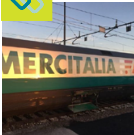
PESI E DIMENSIONI