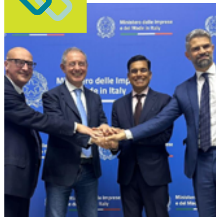
AL MIMIT LA FIRMA PER IL RILANCIO DI PIOMBINO